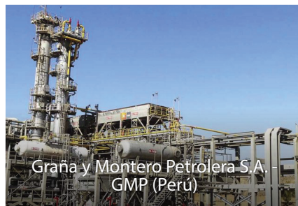
Graña y Montero Petrolera S.A. - GMP (Perú)