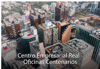
Centro Empresarial Real - Oficinas Centenarios