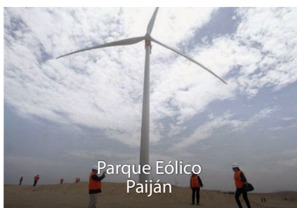
Parque Eólico Paiján