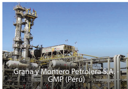
Graña y Montero Petrolera S.A. - GMP (Perú)