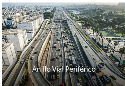
Anillo Vial Periférico