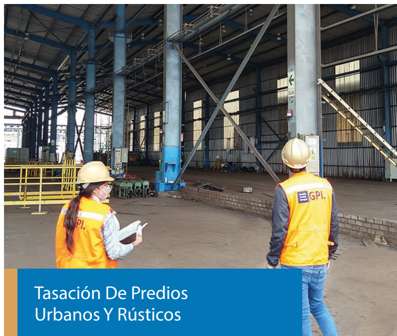
Tasación De Predios Urbanos Y Rústicos