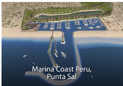
Marina Coast Peru, Punta Sal