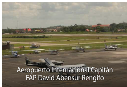
Aeropuerto Internacional Capitán FAP David Abensur Rengifo