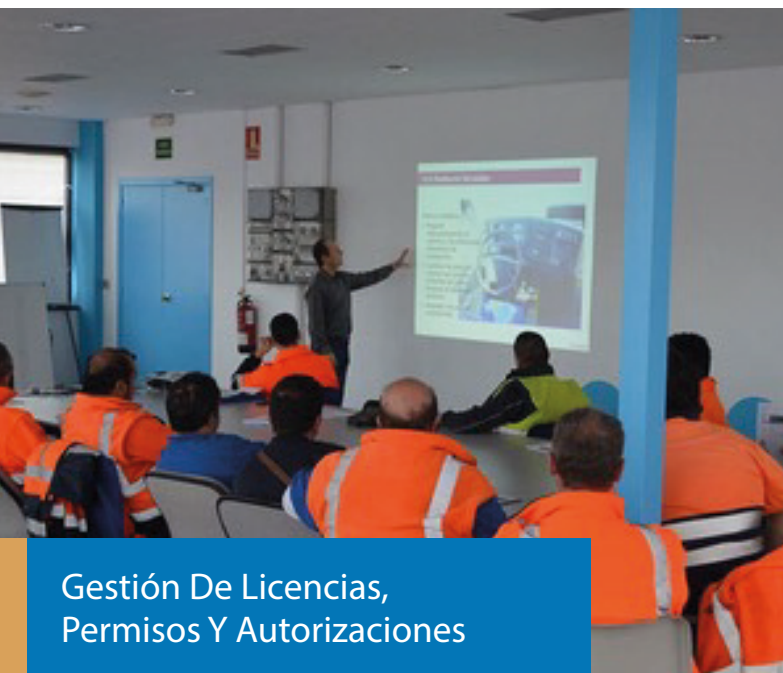
Gestión De Licencias, Permisos Y Autorizaciones