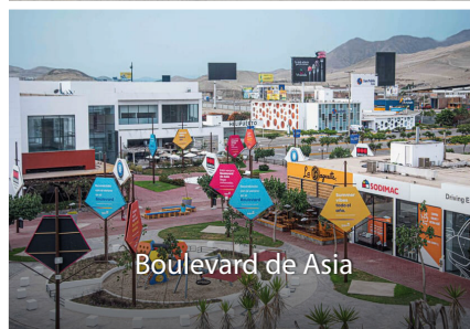
Boulevard de Asia