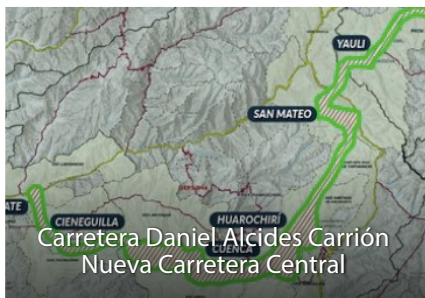
Carretera Daniel Alcides Carrión Nueva Carretera Central