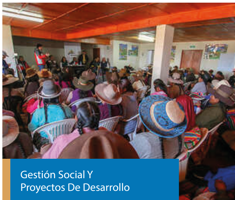
Gestión Social Y Proyectos De Desarrollo