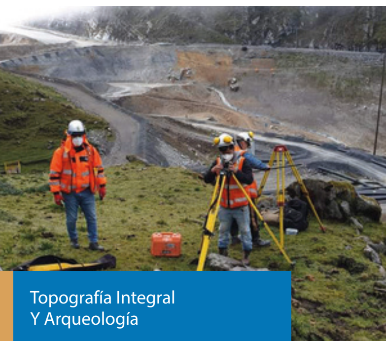
Topografía Integral Y Arqueología