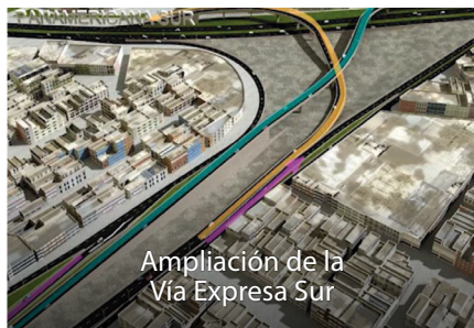
Ampliación de la Vía Expresa Sur