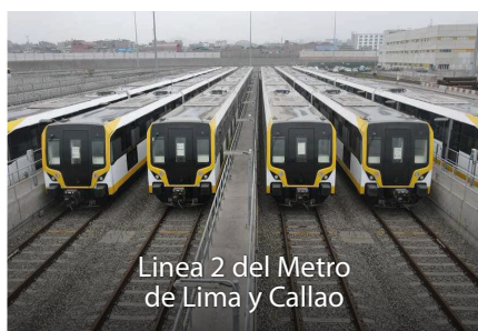
Linea 2 del Metro de Lima y Callao