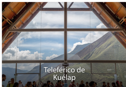
Teleférico de Kuélap