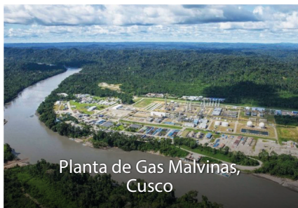
Planta de Gas Malvinas, Cusco