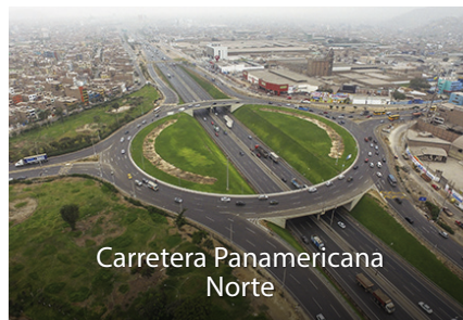
Carretera Panamericana Norte