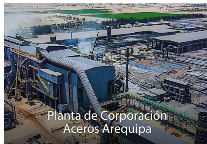
Planta de Corporación Aceros Arequipa