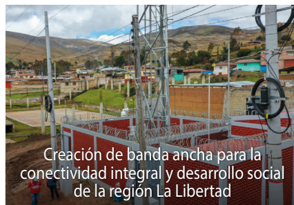
Creación de banda ancha para la conectividad integral y desarrollo social de la región La Libertad