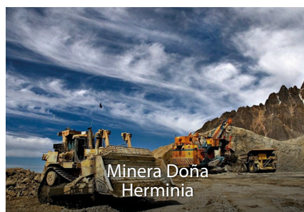
Minera Doña Herminia