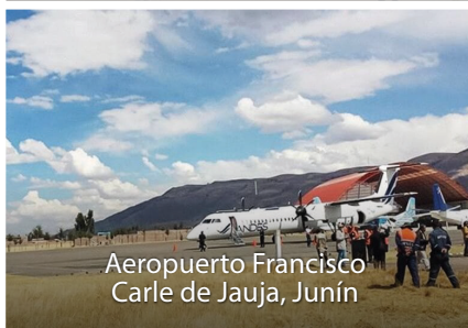
Aeropuerto Francisco Carle de Jauja, Junín