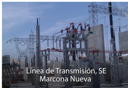
Línea de Transmisión, SE Marcona Nueva